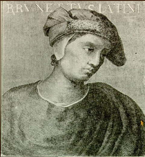
Ritratto di Brunetto Latini, nella Galleria di Firenze.